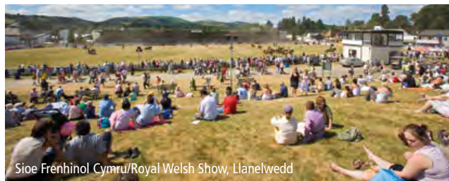
Sioe Frenhinol Cymru/Royal Welsh Show, Llanelwedd

Caiff aelodau o Gymdeithas Teithwyr Rheilffordd Calon Cymru brynu'r cerdyn rheilffordd waeth beth fo eu cod post.